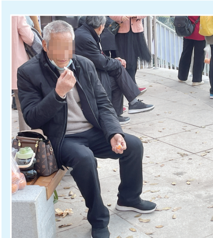
一名老人将橘子皮随手丢在地上。