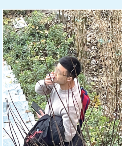
一名男子旁若无人地吸烟。