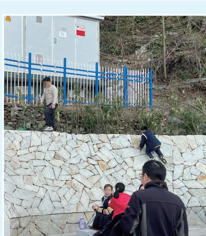
两名儿童在护墙上攀爬嬉戏。