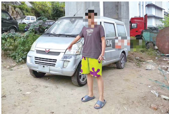
嫌疑人小辉指认作案现场。