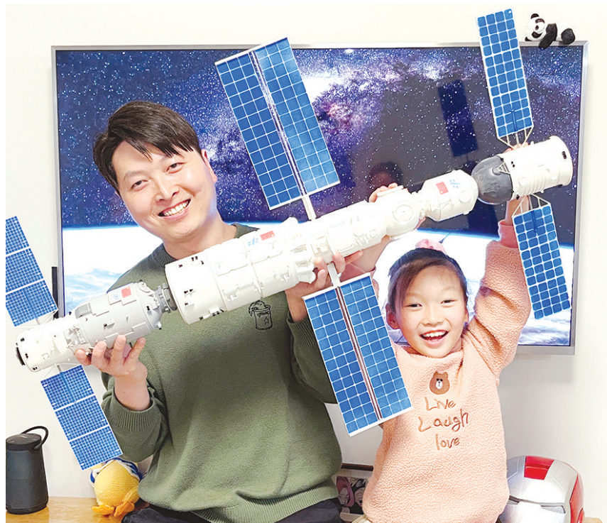
尼尼开心地和爸爸展示空间站模型。