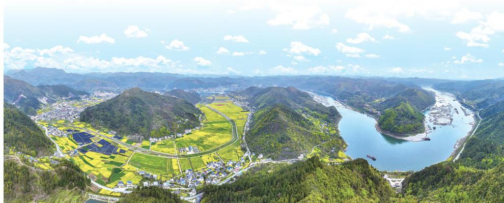
俯瞰郧阳区五峰乡，右边是蜿蜒的汉江河，左边是汉江截弯取直后留下的连片平整良田。

不过，尽管河流越来越弯，最终也有由弯变直的一天。当砂石不断往凸岸堆积，凹岸不断被侵蚀，最终河曲会渐渐独立出来。而原本的河道也会因此截弯取直，变回直线。这就是五峰段汉江改道的秘密。