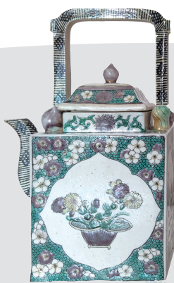
青花瓷方形提梁壶十分少见。