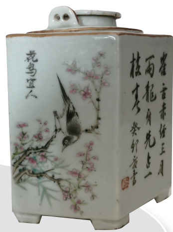
六面方形壶的壶身布满花、鸟、诗词，十分雅致。