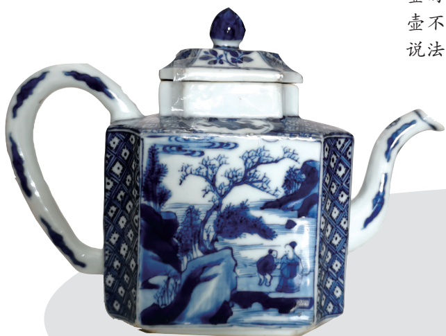
青花瓷方形壶的壶身绘有“松下问童子”的故事，画面生动传神。