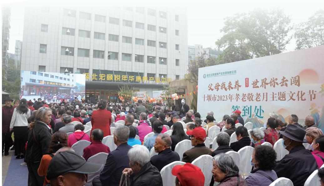
我市2023年“孝老敬老月”主题文化节启动仪式在宏颐悦年华康养中心举行。

桐花万里,凤凰于飞。未来,湖北宏颐健康产业发展有限公司将致力于康养产业与旅游产业、绿色农业等融合创新,引领十堰康养旅居产业实现凤凰涅槃、蝶变花开,助力十堰经济倍增,实现跨越发展。