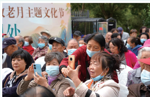
精彩的表演吸引现场观众拍照留念。