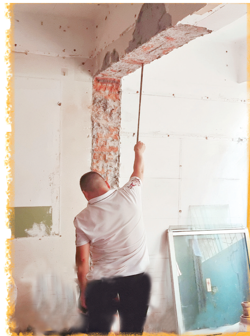
邮电街一小区房主擅自变动房屋承重结构,市装饰办要求房主立即停工接受调查。