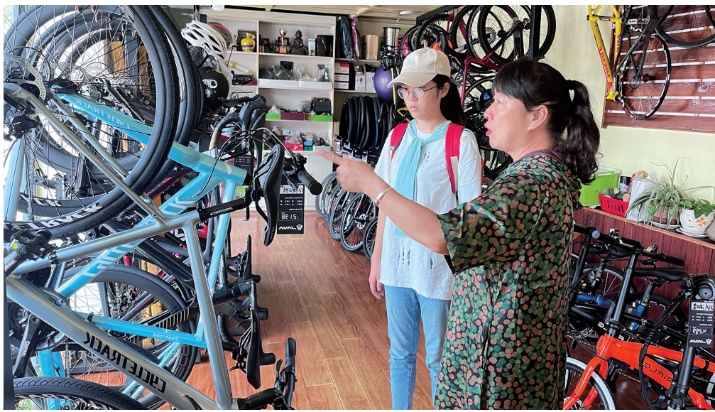
一位市民带孩子佳在佳沃自行车专卖店挑选自行车。