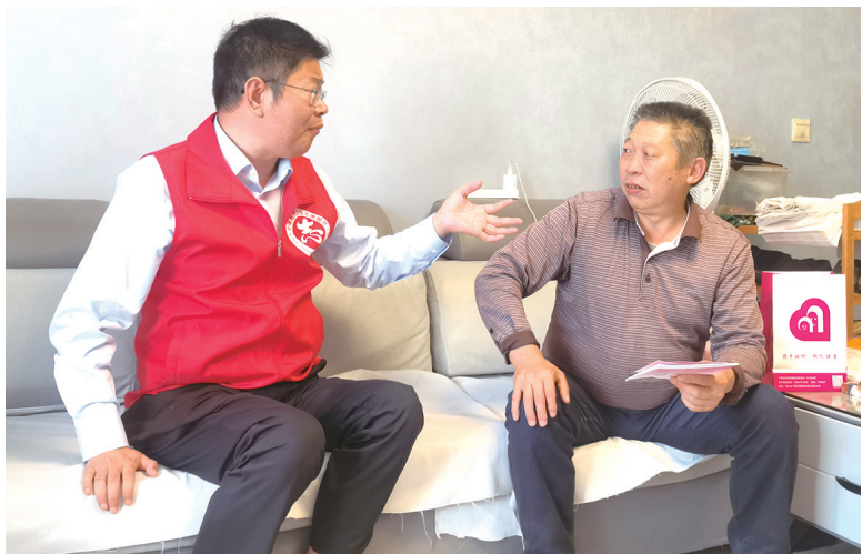
市妇幼保健院志愿服务队人员上门为居民提供医疗服务。

“此前,市妇幼保健院已下沉小区多次开展义诊活动,每周一下午的健康讲堂和党课宣讲已开展了两年。下一步,医院还将重点面向片区孤寡、高龄老人加大服务力度。”曾传军说。