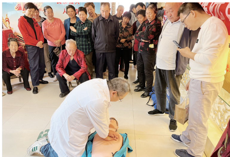
市妇幼保健院医护人员现场示范急救措施。