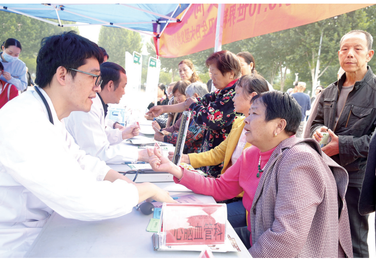
专家耐心地为前来咨询的市民答疑解惑。

义诊现场,通过心理卫生专家的科普介绍,很多市民知道了每年的10月10日是世界精神卫生日,随即,围绕着家人特别是小孩子的各种“不正常”行为,家长们更是问个清楚明白。孩子一天到晚都要玩手机游戏咋办?孩子不愿意跟家长沟通交流咋办?孩子好动厌学咋办?……面对家长们急切的眼神,专家们耐心地帮忙分析这些行为的心理原因,