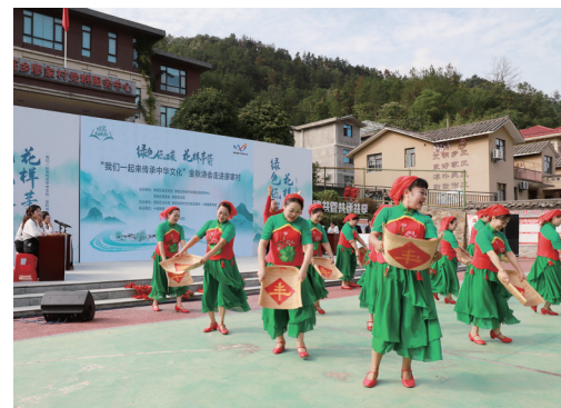
开场歌舞吸引着村民。

连日来,茅箭区围绕“绿色低碳文明先行”目标定位,结合文化旅游、乡村振兴、青少年健康成长等领域实际,积极开展丰富多彩的文艺演出、阅读推广、文化惠民、孵化培育、旅游推介等活动。