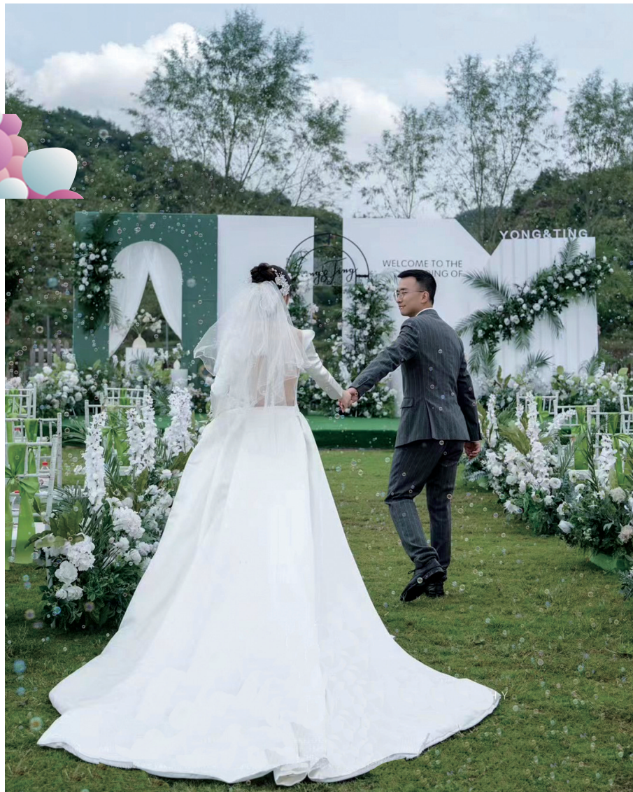
韩式简约风白绿色森系草坪婚礼很受年轻人欢迎。