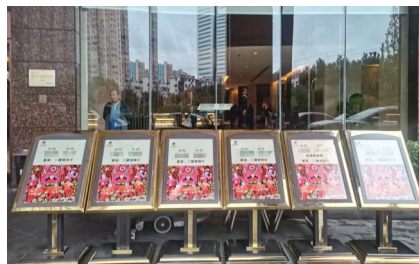
10月3日,有6对新人在武当国际酒店办婚礼。