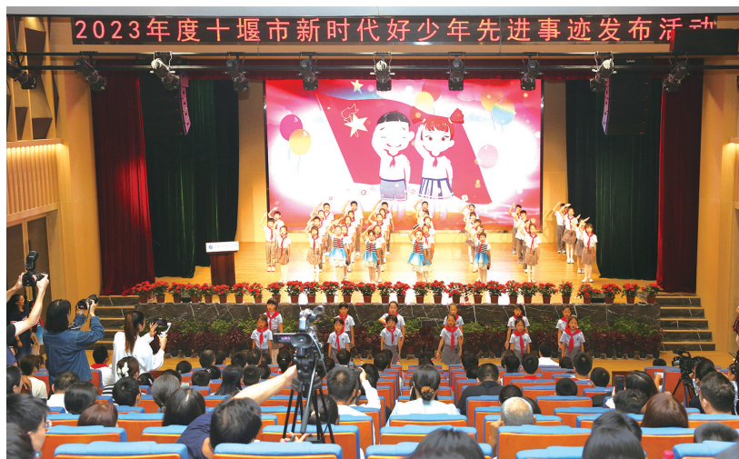
全体“新时代好少年”共同向全市广大青少年发出倡议。

全体“新时代好少年”共同向全市广大青少年发出倡议:时刻牢记习近平总书记的谆谆教诲,立志向、