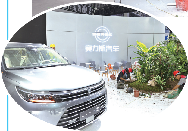
工作人员摆放绿植。