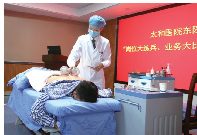
3月21日,市太和医院康复院区开展岗位大练兵、业务大比武活动。