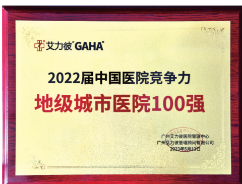
2022届中国医院竞争力地级城市医院100强排名第9位。