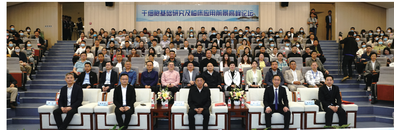
基础研究及临床应用前景高峰 4月21日,市太和医院举办干细胞论坛,国内外大咖参加盛会。

截至目前,市太和医院建成1个省级重点实验室,建起10余个研究室及8个公共科研平台,连续两年在湖北省科技厅组织的考核中名列前茅。该院先后有259项科研成果通过鉴定,213多项科研成果获得教育部、国家卫健委及省、市科技进步奖,承担30余项国家自然科学基金课题。科研综合实力持续稳居全省市州三甲医院前列。