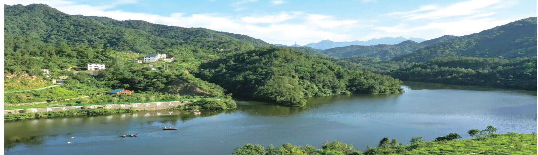
茅塔河水库碧波粼粼。