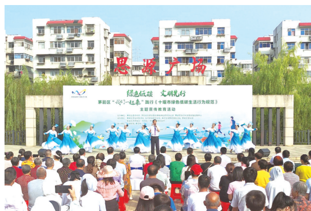
茅箭区举行《十堰市绿色低碳生活行为规范》主题宣传教育活动。

2023年8月30日,茅箭区委十届四次全会举行。全会指出,茅箭区委全面落实党中央决策部署和省委、市委工作要求,主动融入大局,推动绿色低碳发展在茅箭落实落地。