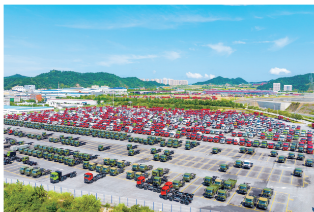
十堰因车而建,因车而兴,汽车文化激励着茅箭人奋向上。