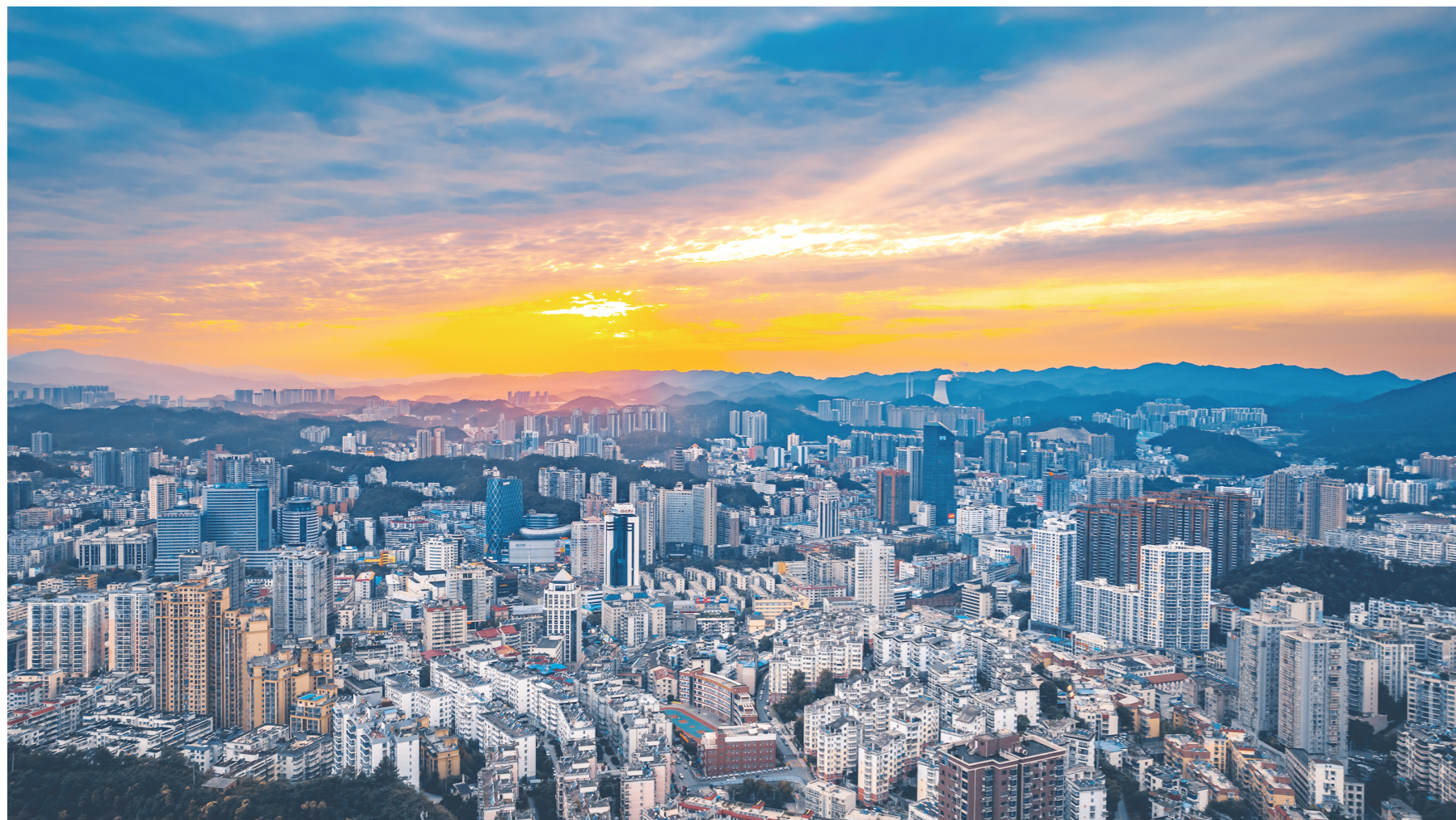
茅箭全景。