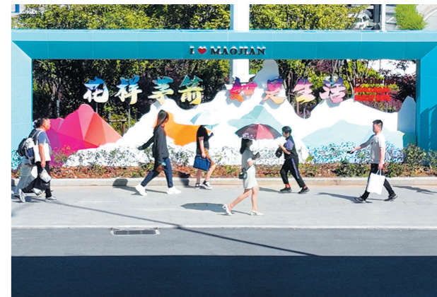
位于上海路、北京路、重庆路交会处的新建地标“茅箭之窗”。