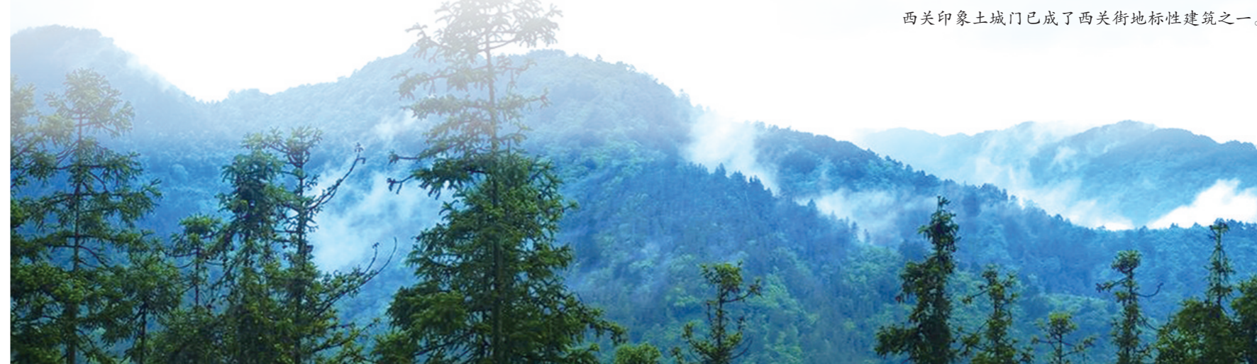
诗经源国家森林公园。