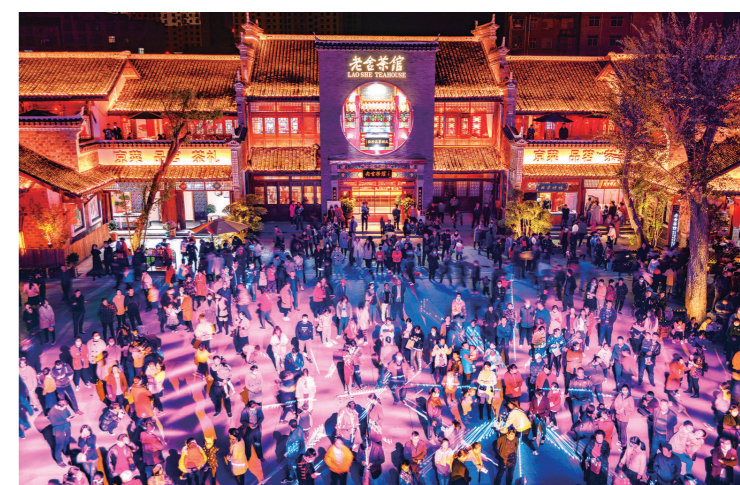
西关印象已成为十堰小有名气的“网红打卡地”。

公共服务一应俱全,基层治理成果显著,民生保障坚实有力、人才发展环境优渥。一幅美丽房县、幸福房县的画卷正在徐徐展开,由全体房县人用双手共同绘就。