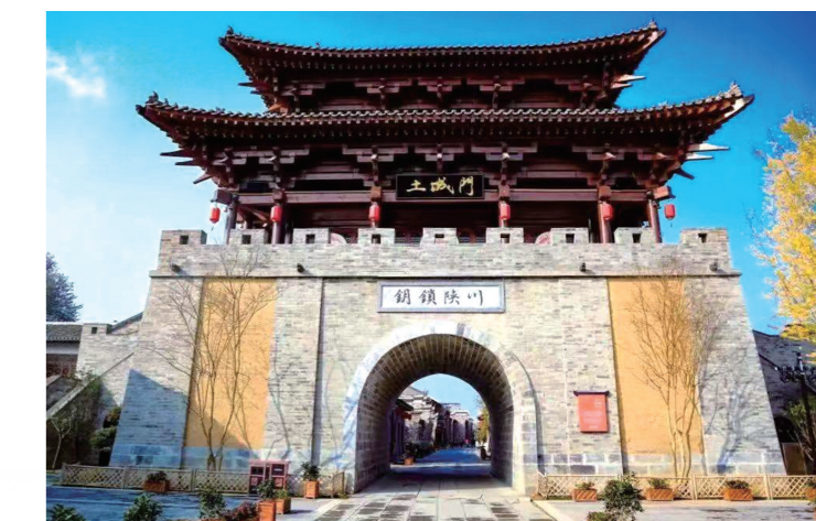
西关印象土城门已成了西关街地标性建筑之一。