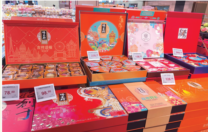
稻香村、侨香村等知名品牌月饼礼盒价格大多在80元至300元。

城区部分商超、烘焙店发现,月饼礼盒区高档包装褪去,价格也亲民了许多,高价月饼基本退出市场。