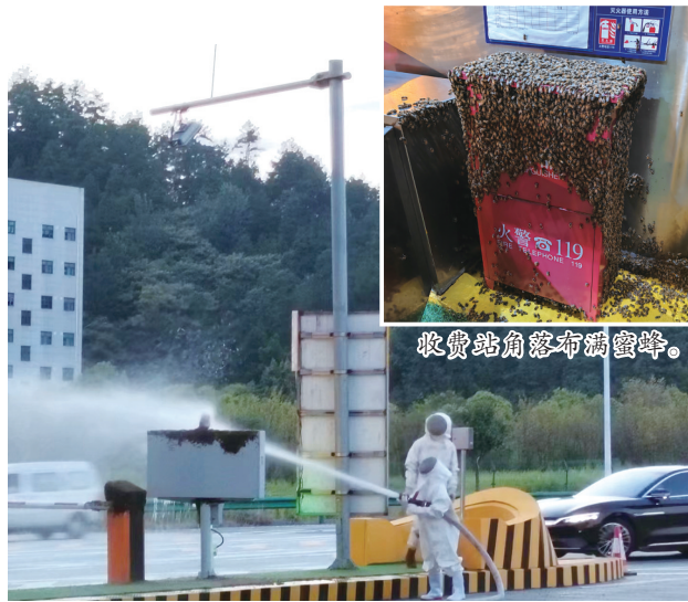
高压水枪驱散蜜蜂。