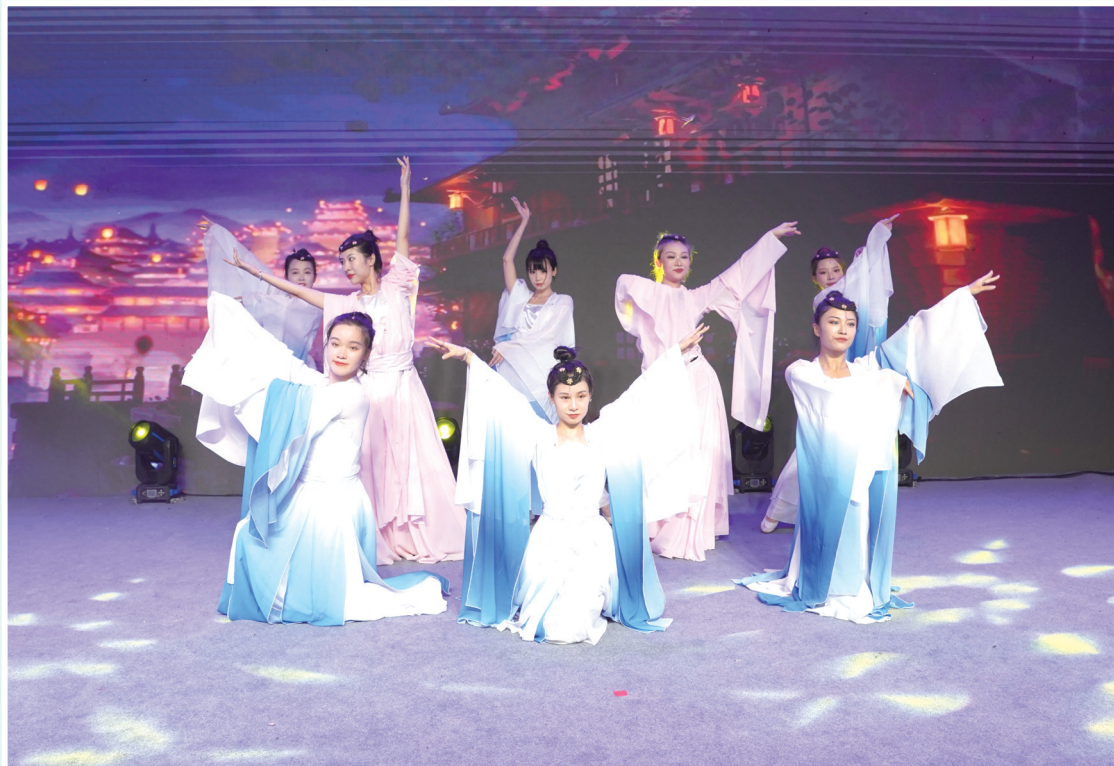
身着古装的美女们举手投足间演绎风情万种。