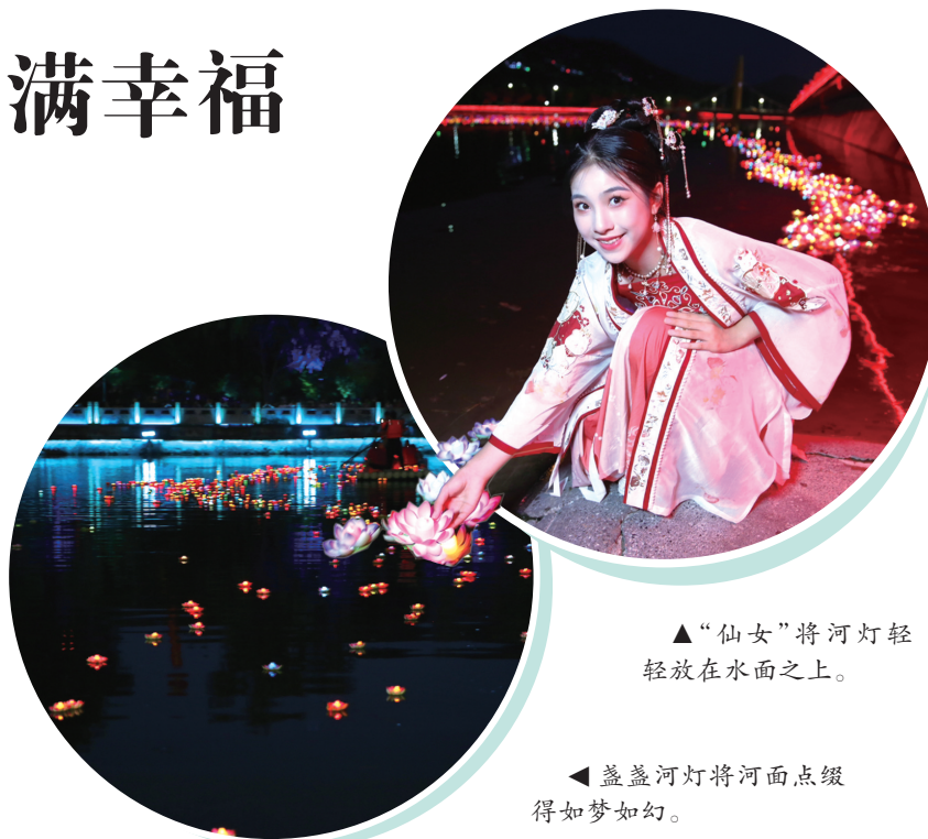
▲“仙女”将河灯轻轻放在水面之上。

如今,随着时代的发展,放河灯的意义也有了新的变化。一盏盏河灯缓缓漂向天河,带着人们爱的誓言和美好祝愿,祈盼天下有情人终成眷属。