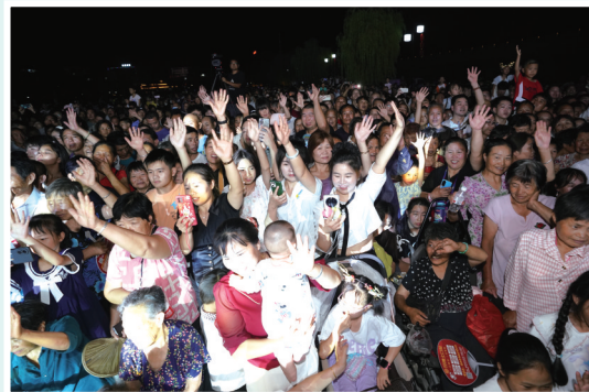
精彩的演出吸引了众多游客。