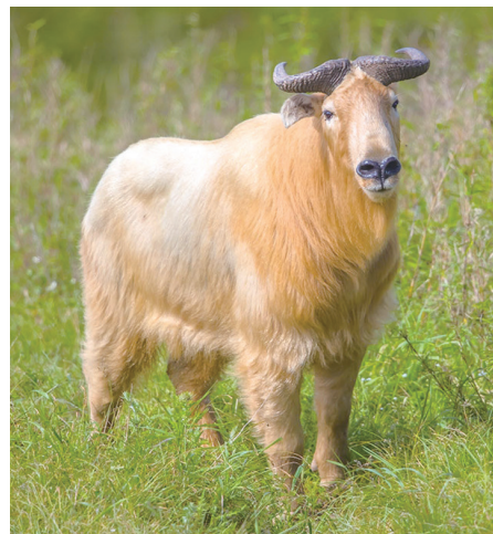
羚牛通体金黄中泛着白色,头顶一对犄角。