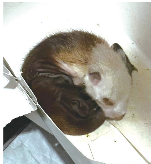
这只红白鼯鼠周生长着灰褐色和白色相间的绒毛,尾巴长长的。

事后,民警联系到市野生动物救助站。救助站工作人员到派出所查看后,确认这只小动物是国家二级保护动物红白鼯鼠。随后,救助