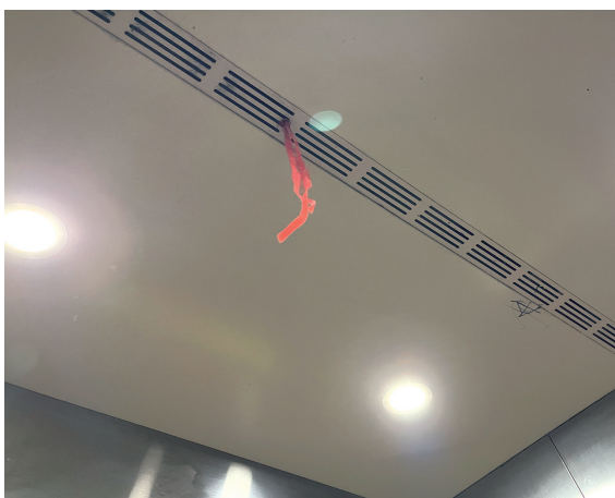
凯旋大道国瑞蓝山郡电梯加装了空调,开启后凉风阵阵。