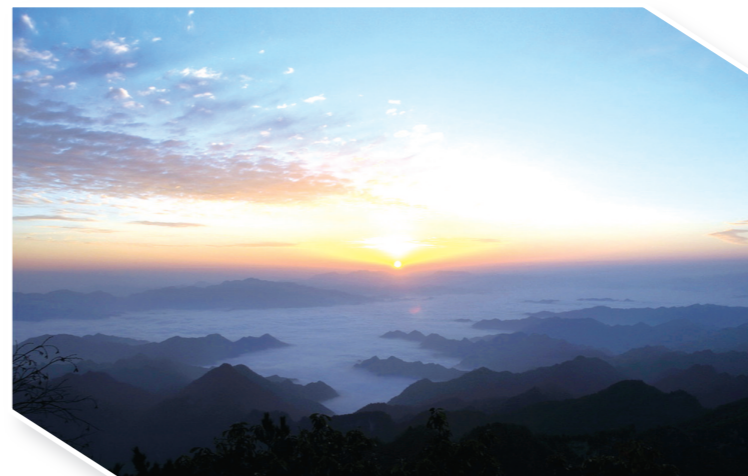
沧浪山云海苍茫。