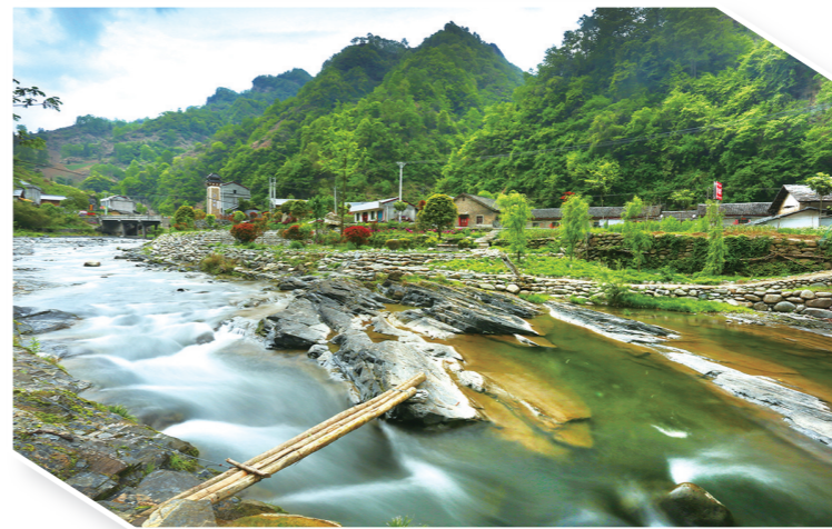
竹溪石板河溪水清澈见底。