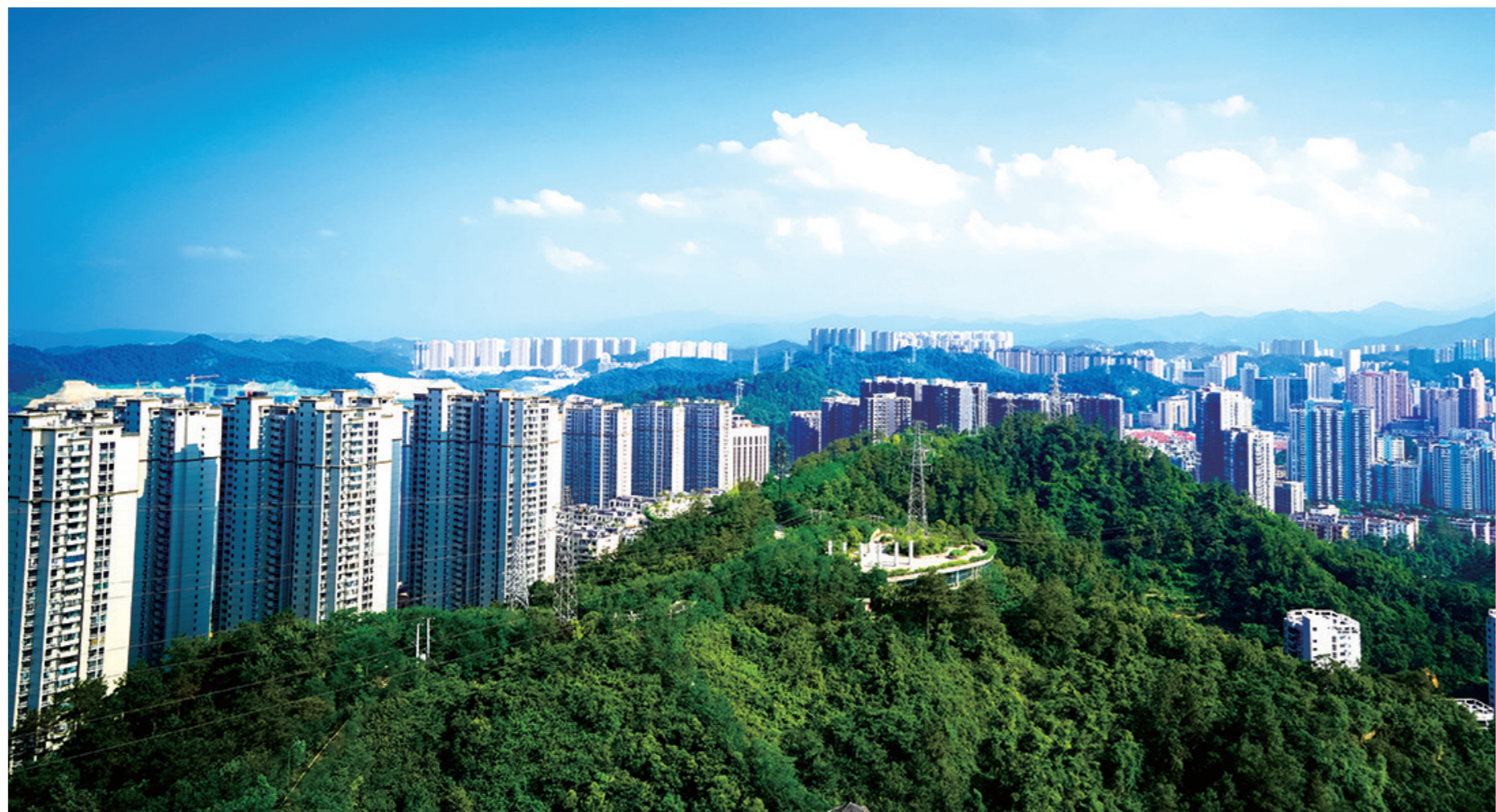
福山公园俯瞰城市美景。图/记者 刘仲黎