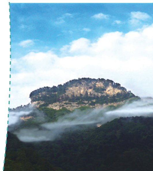
赛武当美景如画。

在张湾区花果街道放马坪古巷,有一座汽车模型博物馆。这座汽车模型博物馆如同一本鲜活的十堰历史教科书,穿梭其中,就像走进时空隧道,得以窥见车城的历史。炎天暑月,一个人去打卡这座博物馆,开启时光之旅,好不惬意。