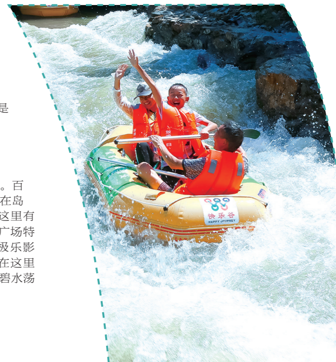
漂流让身心得到放松。

想要放松心情,百喜岛是必去之地。百喜岛景区位于丹江口水库核心水域,站在岛上可以领略“小太平洋”的美丽风光。这里有波光粼粼的水面,景区内还有旅游文化广场特色风情街、水上乐园、热带雨林温泉、极乐影视城等景点,是自驾不错的选择。夏天在这里露营,非常惬意。夕阳西下,晚风轻拂,碧水荡漾,能感受到小岛独特的风情。