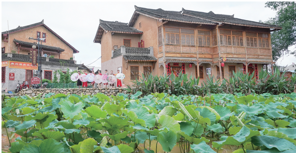
老街共有保存较好的古民居386户,多是明清时代的建筑。

行走在老街,可见慵懒的猫咪坐在门前打哈欠,路边嬉戏的孩子追逐打闹,银发老人安静坐在院内回忆时光……让人顿生一种远离尘嚣、怡然自得之感。老街共有保存较好的古民居386户,多是明清时代的建筑。每一块青砖黛瓦,每一处画龙雕凤,都历经岁月沧桑,依稀可见当年的繁华。