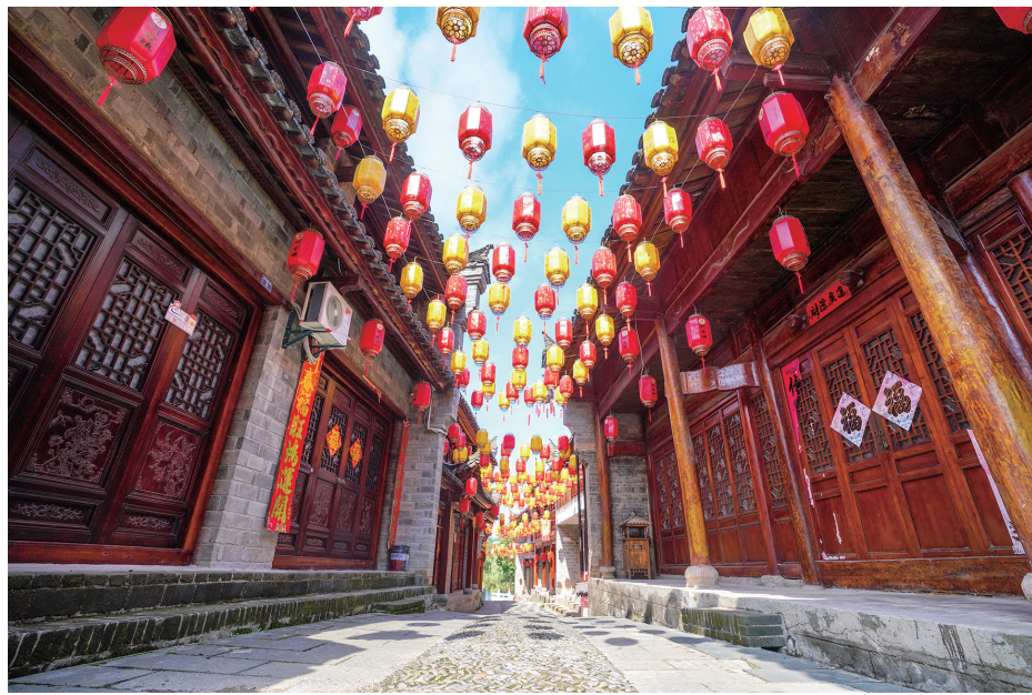
军店老街道路用青鱼脊石纵向砌成,石面花纹不同,排列图案各异。路面呈龟背形,既美观又便于排水。