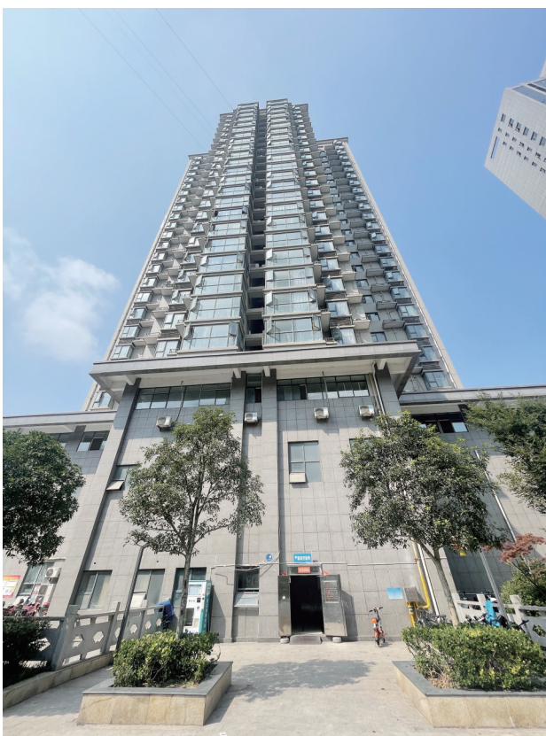
该小区1号楼一单元楼栋门处于敞开状态,门上安装的可视门禁系统停用。