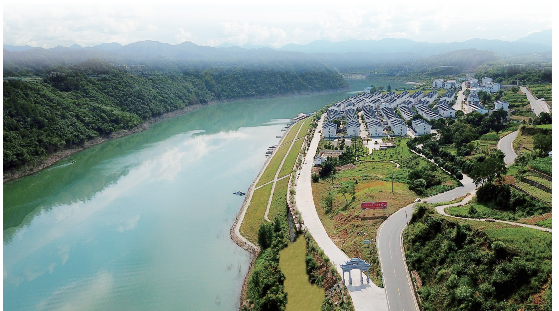
方滩堵河画廊美如画。张湾区供图