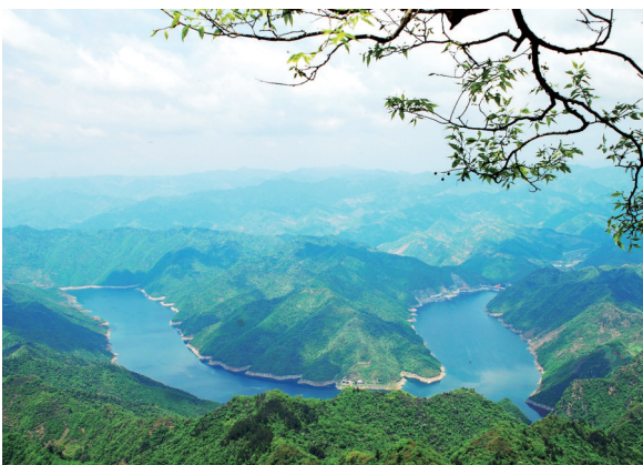
从白马山俯瞰秀水青山。

在夏日余晖中,来到山谷见露营基地,目之所及皆是绿草如茵,你可以骑马驰骋,也可以躺在草坪上,让朋友给你拍一组漂亮的风光照。花果蔡家村紧邻头堰水库,村里鸟语花香,俨然一个世外桃源,一幅望得见山、看得见水的田园生态图展现在眼前。沿路而行,来到桃子村,百龙潭景区内石奇水秀,引得众多市民前来避暑纳凉,被市民亲切地称为“车城九寨沟”。