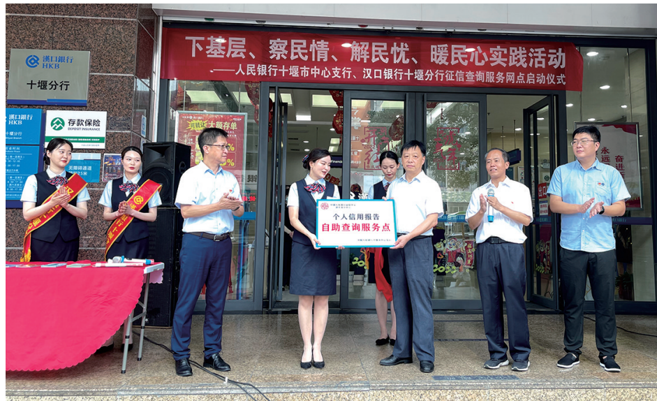
人行十堰市中支坚持征信为民理念,满足线上+线下多元化征信查询服务需求。