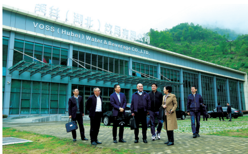
5月10日,人行十堰市中支到美丝(湖北)饮品有限公司开展动产和权利担保登记及绿色金融调研。

征信是一把“金钥匙”,在推动全市社会信用体系建设和信用经济发展中发挥着愈加重要的作用。人行十堰市中支将持续提升征信管理与服务水平,为经济发展谋势,为美好生活赋能。