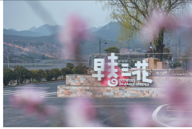
去早春三花民宿住上几日,过一段悠然生活。