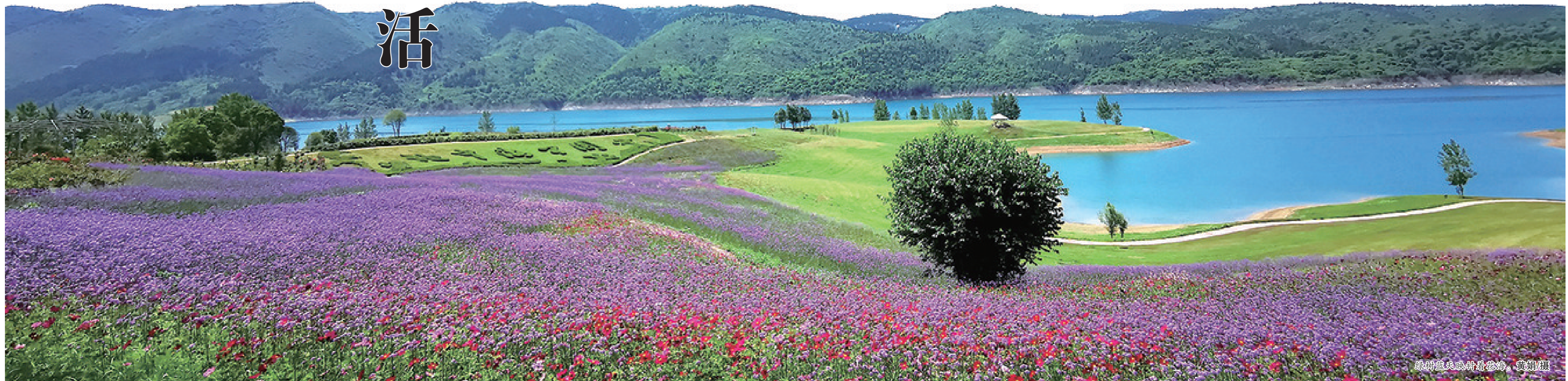
绿野无边映湖畔花海。

在竹溪县龙王垭茶园,沿着山间小径蜿蜒而上,层林叠翠,清新的空气扑面而来。这里建有龙王垭养生山庄、陆羽文化广场、龙峰客栈、生漆博物馆、露营基地、森林健康中心、茶体验综合体等旅游项目。万亩茶林绵延起伏,清香四溢,正是一处悠然度假的好去处。