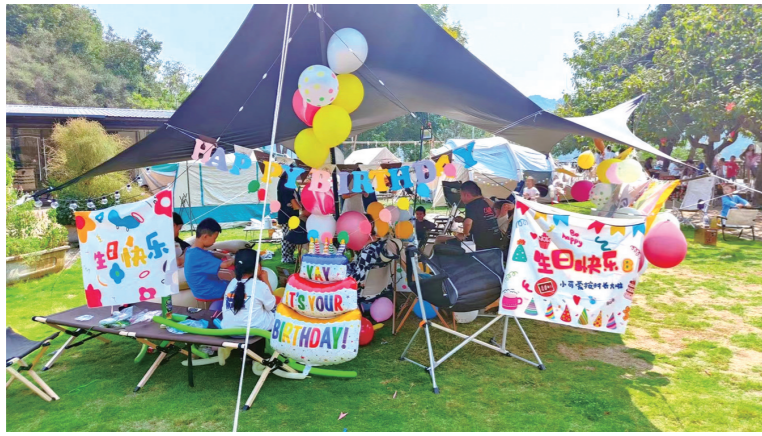
周末,和三五好友一起去露营。