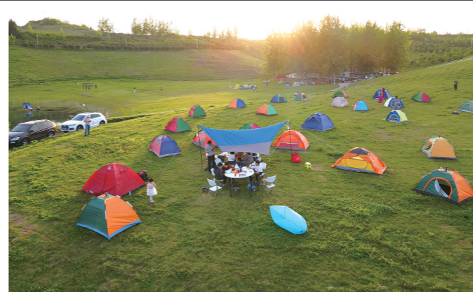
在广阔的草坪上扎一顶帐篷,让孩子们尽情撒欢。