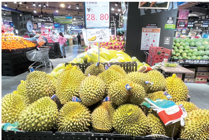
受金枕榴莲价格的影响,干尧榴莲的价格每斤也上涨到20多元。