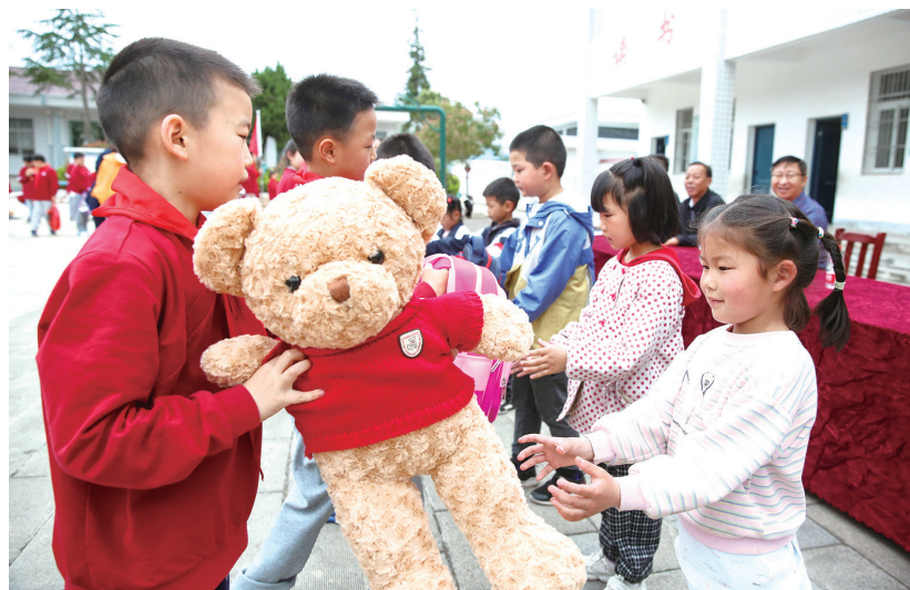
市东方远志学校的学生将礼物送给楼房小学的学生。