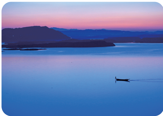
作者:王平萍 单位:十堰市老年大学

赏析:在创作过程中,常遇到撇捺伸展的字,字中撇捺固然要尽情伸展,但也要有变化。撇带曲势,捺取直势,一刚一柔,一收一放,尽展字形姿态,使整个字飘逸舒展。