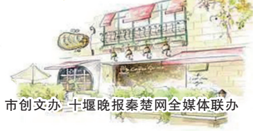
市创文办 十堰晚报秦楚网全媒体联办