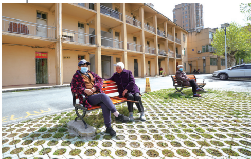
附近老人在这里晒太阳、聊天,好不惬意。