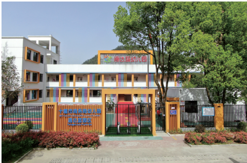
小巷里的一家幼儿园,环境优雅、干净整洁。