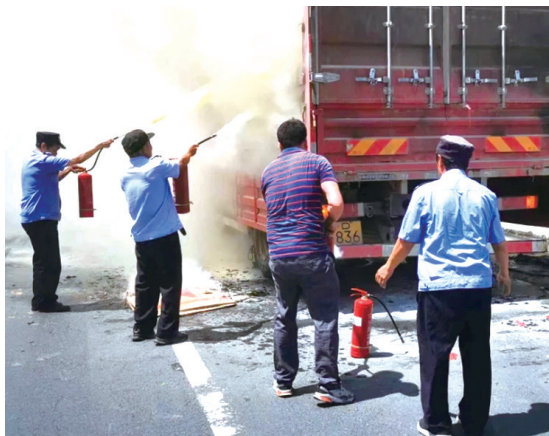
安保人员上阵灭火。