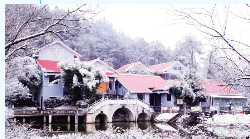
《冬之四方山生态公园》