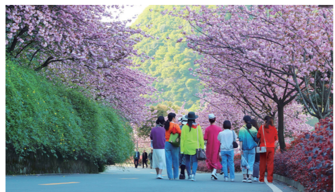
《春之黄龙电厂工业生态旅游区》