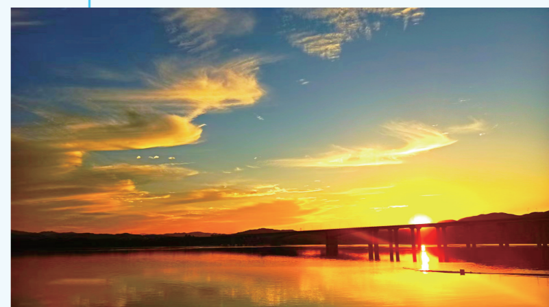
《秋之郧阳龙舟广场》