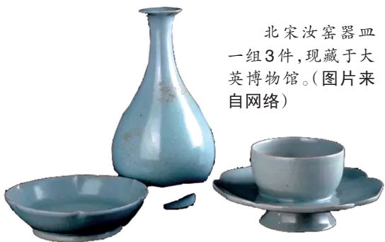
北宋汝窑器皿 一组3件，现藏于大英博物馆。