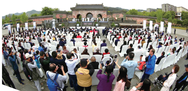
纪念徐霞客登临武当山400周年活动盛大开启。