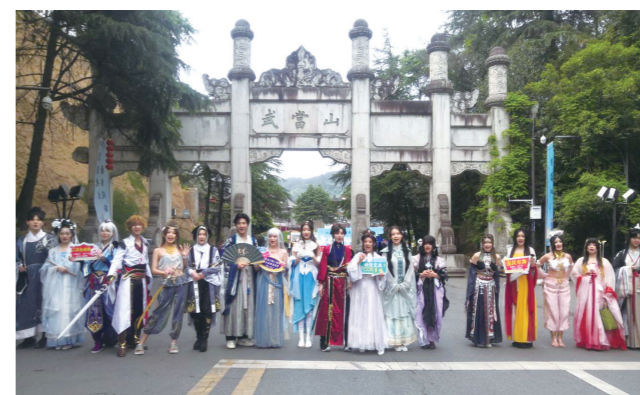
Coser巡游武当山。