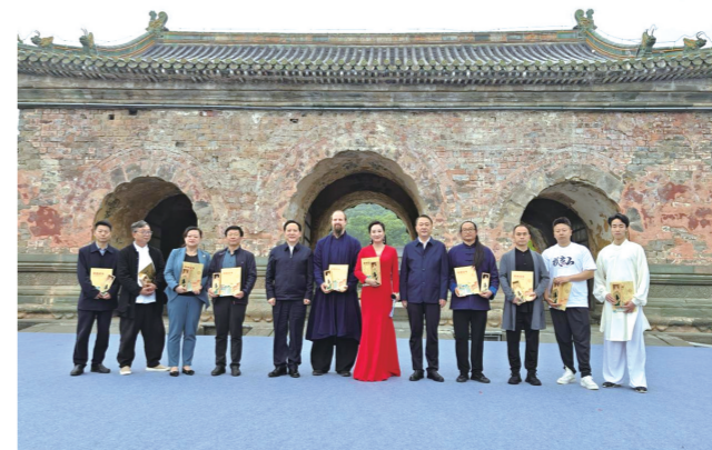
向10位“武当侠客”荣誉山民颁奖。

武当山拥有众多的国字号桂冠,具有优良的旅游资源、文化资源和摄影资源。两大活动的开启,将全面展示武当山世界文化遗产地丰富的文化和旅游资源,通过艺术的形式促进旅游业和服务业发展,助力武当山打造世界重要旅游目的地战略实施。