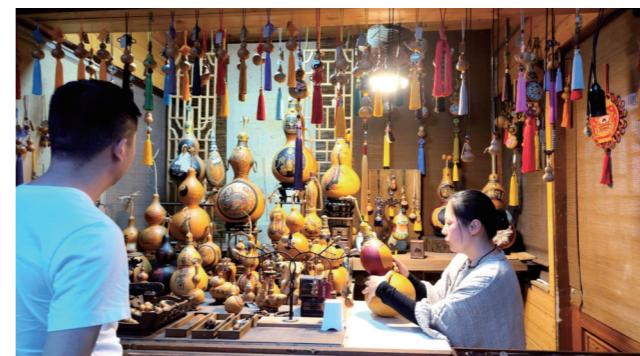
武当山文创产品展示。