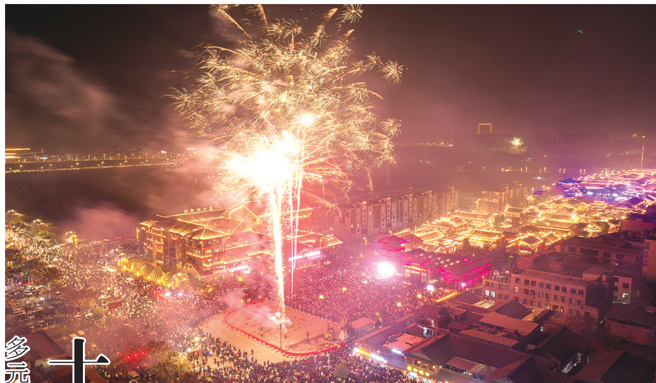
夜晚的房县西关印象灯火辉煌，成为十堰夜游地标之一。