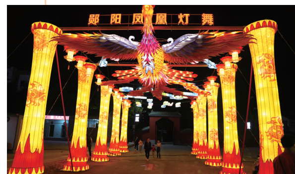
在“武当不夜城”门口，巨大而华美的凤凰灯欢迎八方游客。