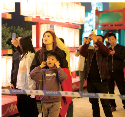
游客目不转睛地欣赏花灯表演。

夜食、夜购、夜娱……丰富多彩的夜间消费活跃了十堰文旅市场，丰富了人们的生活。各大景区纷纷推陈出新，将越来越多的元素融入夜游活动中，营业时间也越来越晚，市民与景区、商户实现“双向奔赴”。如今，越“夜”越美丽的十堰正吸引更多人来打卡游玩，感受这座现代车城的“夜”魅力。