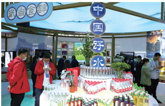
展厅内琳琅满目的各类绿色食品饮料。