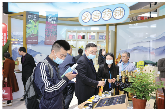
游客在展厅内选购十堰土特产。