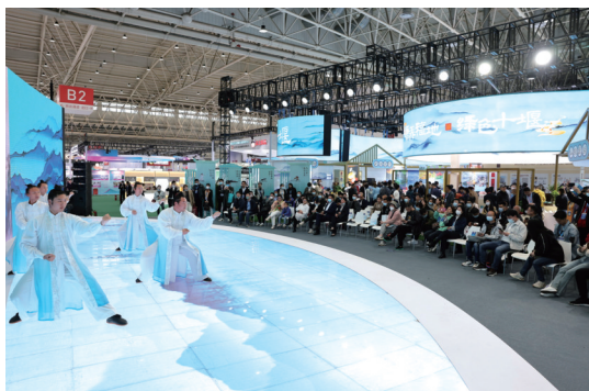
主舞台展示区,精彩的武当武术表演。

陈东升表示,丰富的大健康产业元素、巨大的生产优势和广阔的绿色发展领域,为十堰抓住当前世界的宏观趋势,践行新发展理念,融入新发展格局,全面启动实施绿色低碳发展示范区建设提供了强劲的动力。楚商联合会将发挥好引老乡、回故乡、建家乡的桥梁纽带作用,吸引更多的企业主动关注和参与十堰产业发展,促进友好商会企业家们投资兴业,共同促进国家实现共同富裕征程。