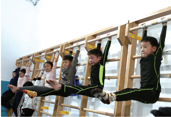
陆上训练,孩子们一点都不马虎。