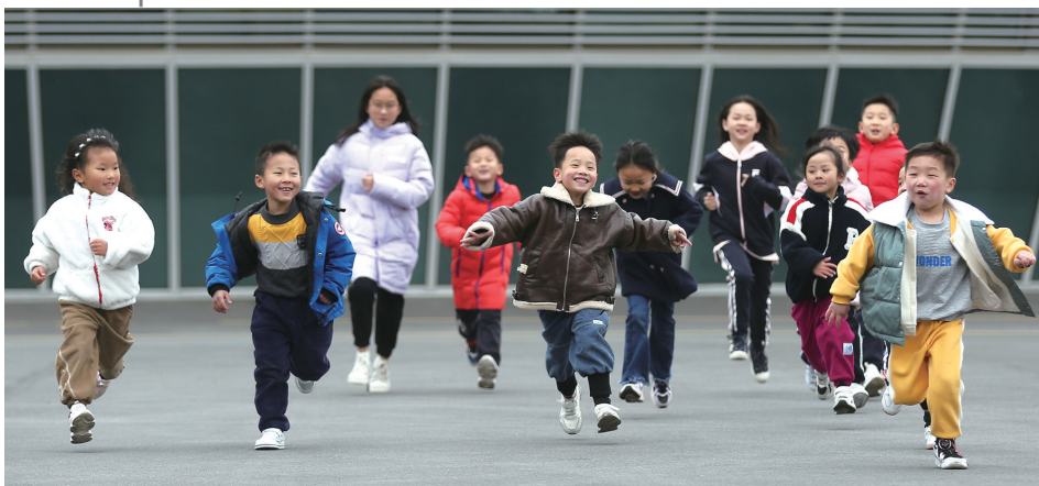
这群可爱的萌娃,承载着我市跳水的希望。