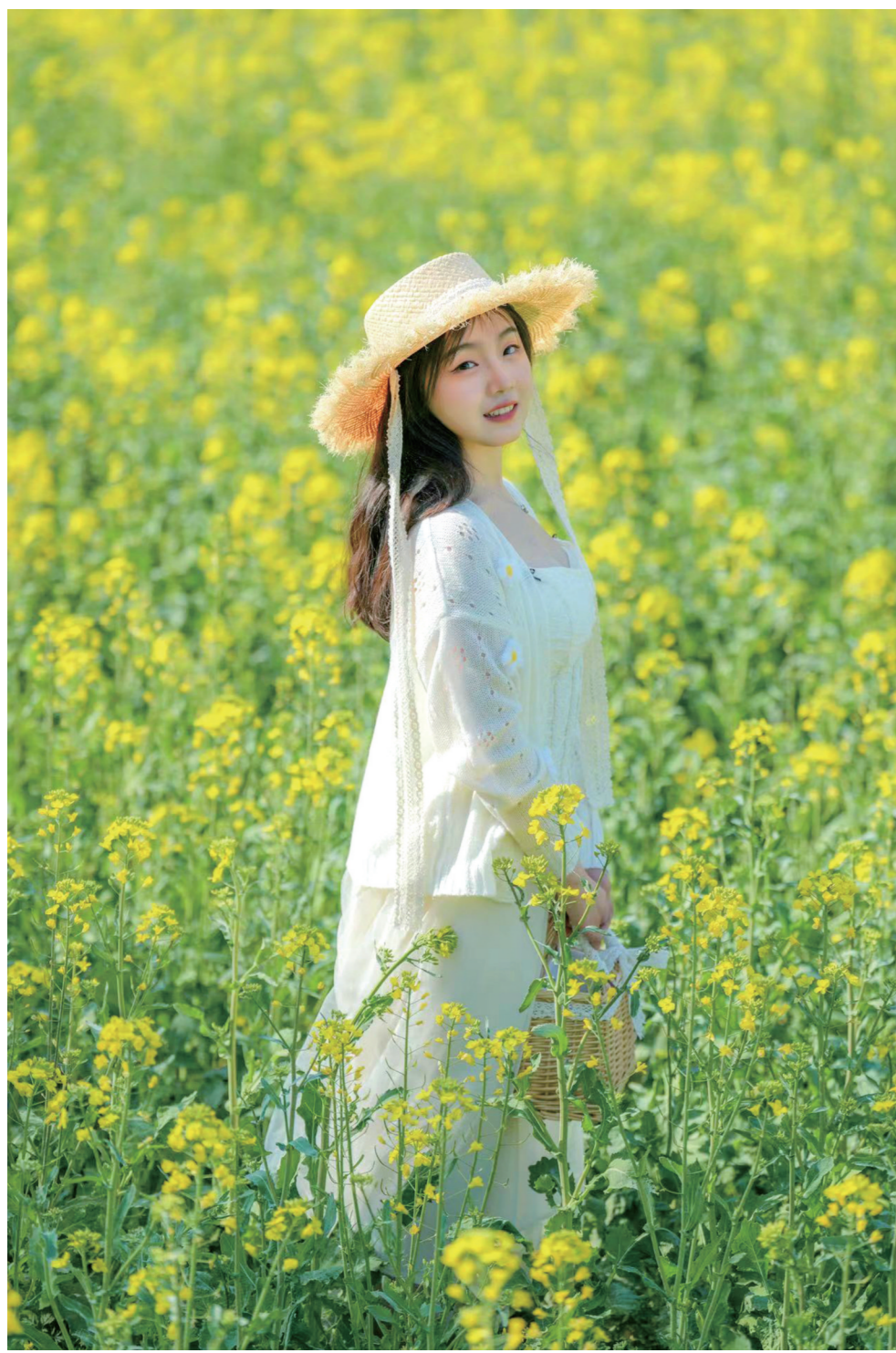
油菜花开灿若金。