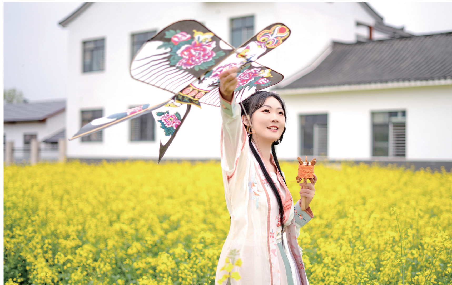
油菜花旁放纸鸢。