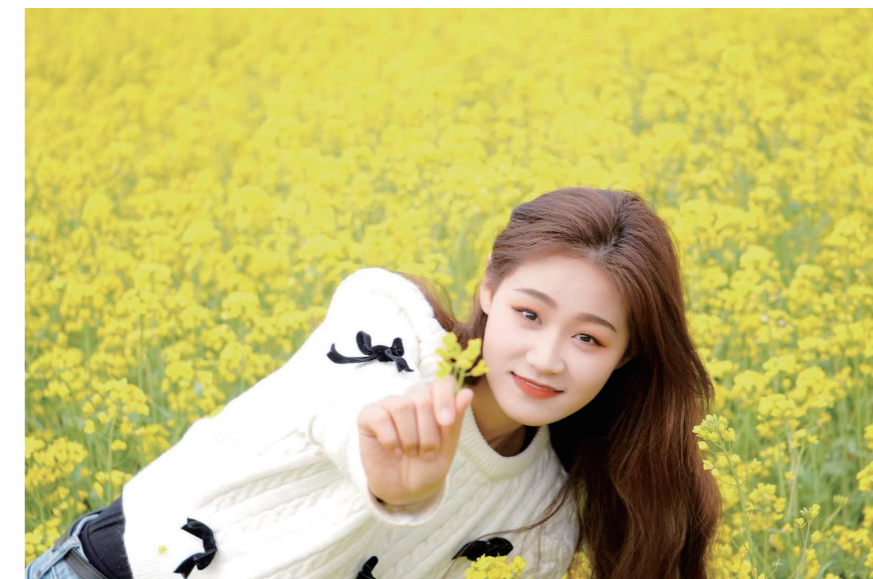
花海之中留倩影。