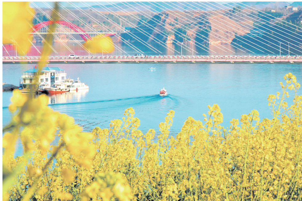
江水菜花美如画。