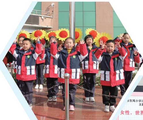
东风小学开展三八妇女节感恩教育活动。