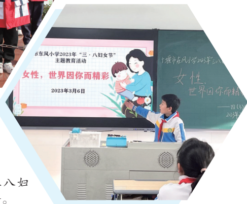
东风小学召开三八妇女节感恩主题班会。