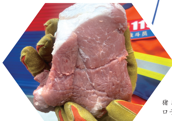
风筝线将猪肉割出一道口子。