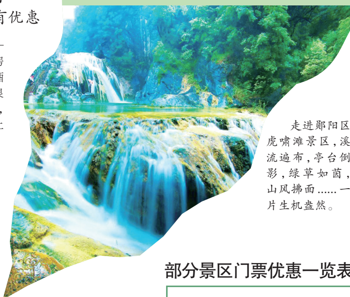
走进郧阳区虎啸滩景区,溪流遍布,亭台倒影,绿草如茵,山风拂面……一片生机盎然。