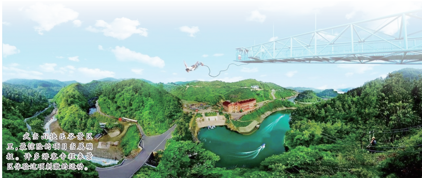
武当山快乐谷景区里,最惊险的项目当属蹦极。许多游客专程来景区体验这项刺激的运动。