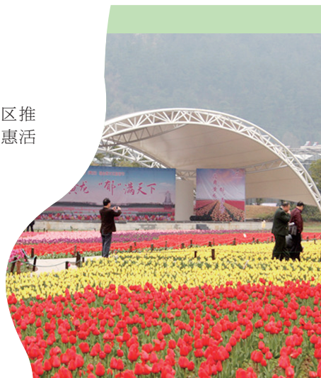
张湾区黄龙壹号生态园内,成片的郁金香盛开,红如火、黄如金,繁花似锦。(资料图片)