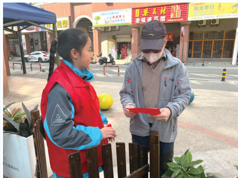
在社区发放环保倡议书。