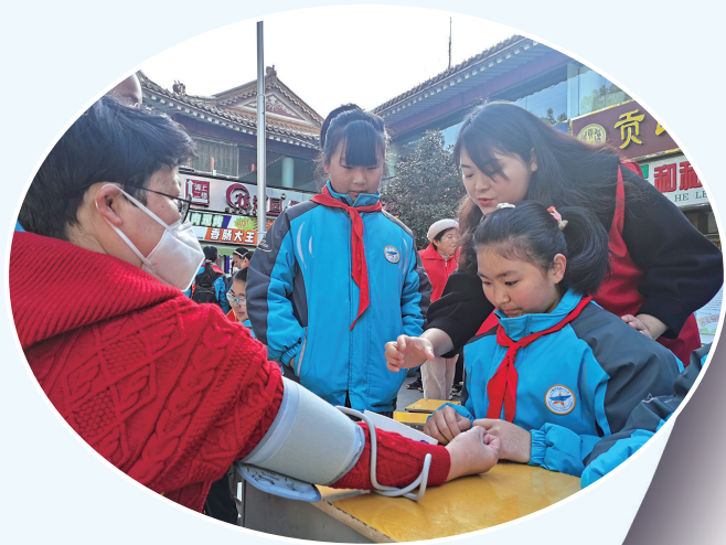
帮市民免费测量血压。