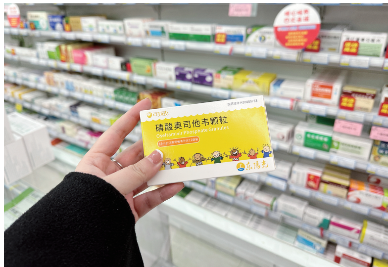
在城区各大药店,奥司他韦充足,大家理性购买。