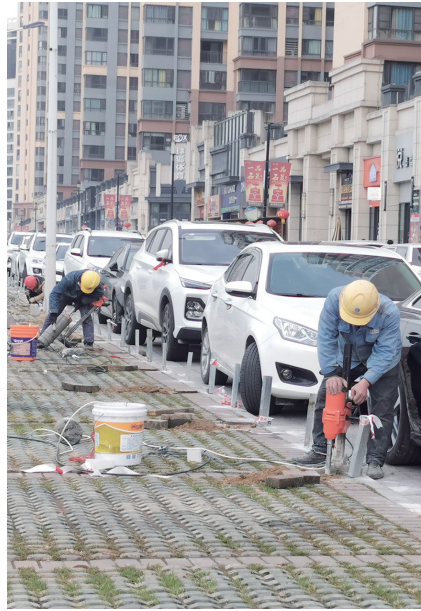
施工人员安装地桩的区域为原公共停车区。

张湾区汉江路街道阳光社区兰书记表示,在发布挪车公告之前,他们已在万达广场爱乐幼儿园附近安排了一些停车位供市民停放,但效果甚微。下一步,他们将和街道、房地产公司、物业一起商讨解决措施。