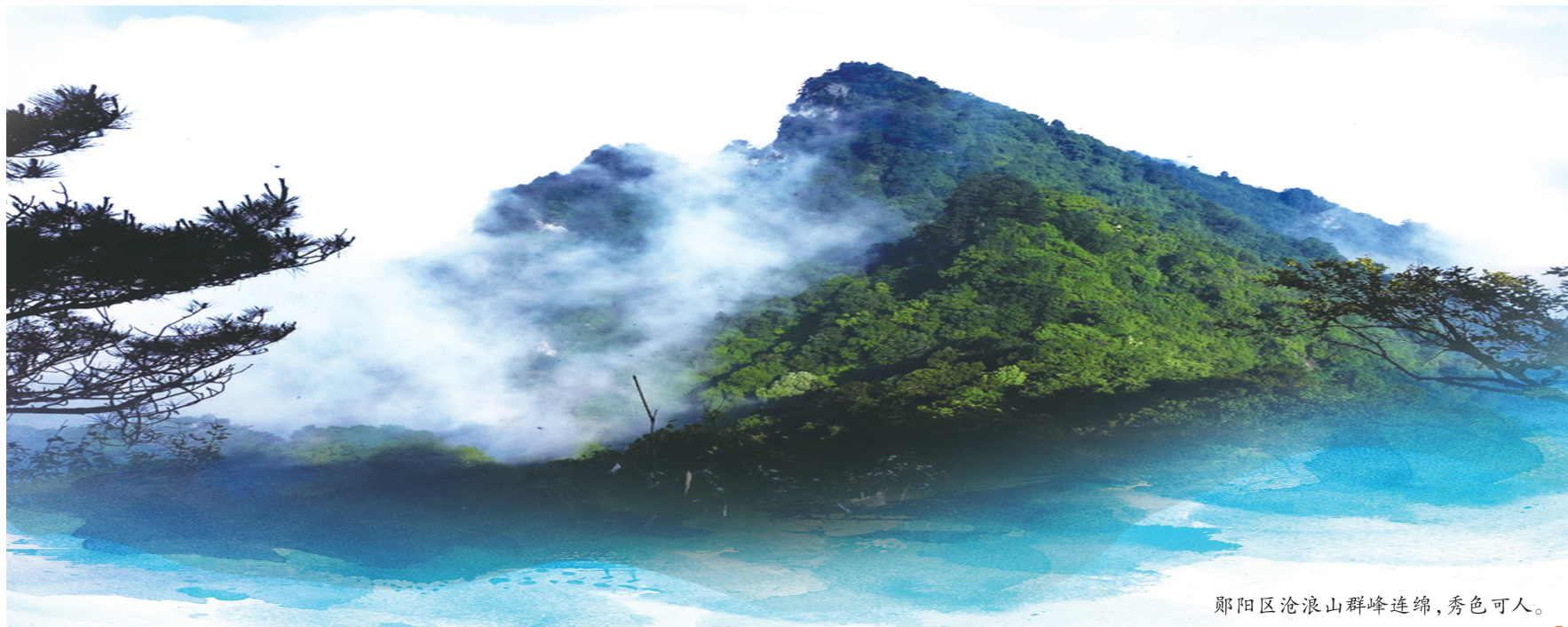
郧阳区沧浪山群峰连绵,秀色可人。