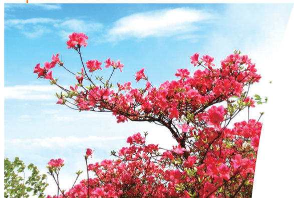
春天,沧浪山杜鹃花红似火。

这样的人间胜境,可康养身心。到沧浪山去,无论在你得意之时还是失意之时,无论是生机勃勃的春夏,还是荣枯一度的秋冬,都是一番身体和心灵之旅。