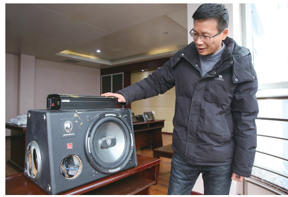
我市查处的第一个伪基站设备。