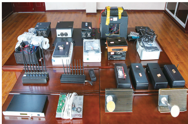
现场展示的“黑广播”、伪基站、屏蔽器等设备。