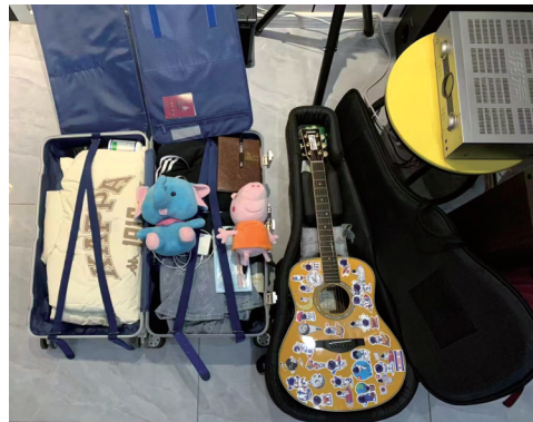
热爱音乐的学生行李箱里装着吉他。