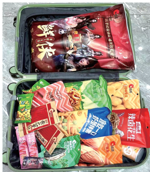
有学生用行李箱装满了零食。